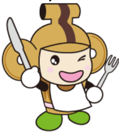
本庄市マスコット はにぼん

当イベントを理解していただくための説明会を開催します！イベントの詳細について、ご案内いたしますので、参加をご検討の飲食店様におかれましては、ご出席くださいますようお願い申し上げます。