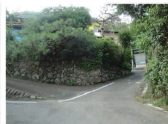
今も残る石垣の路地