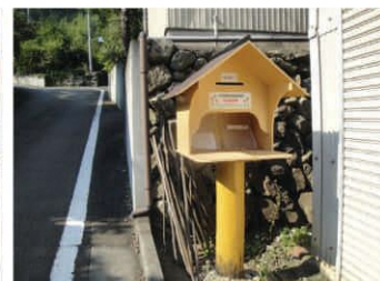
登山口のお便りポスト