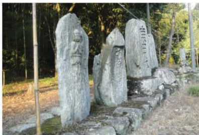
伝え続ける願いと祈り

コースの最高地点(430m)に祀られている 稲沢の地名からも推測できるように、 風は稲作に欠かせないため、 農作に適した風雨をもたらすよう、 「風の神」が祀られるようになった