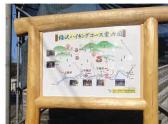
ハイカーを出迎える案内板