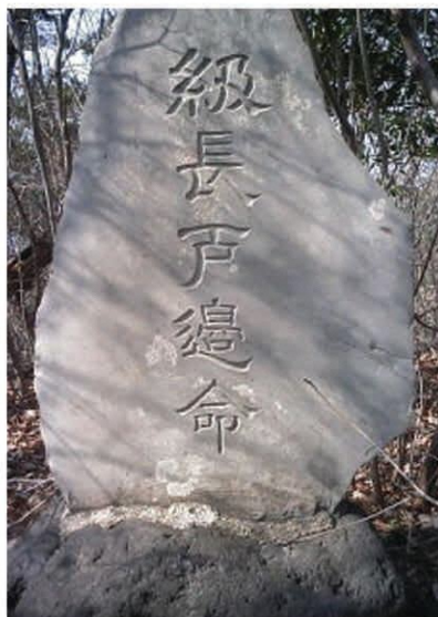
級長戸邊命(シナトベノミコト)碑(風の神)

コースの最高地点(430m)に祀られている 稲沢の地名からも推測できるように、 風は稲作に欠かせないため、 農作に適した風雨をもたらすよう、 「風の神」が祀られるようになった