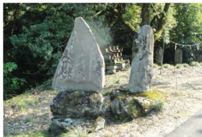
村を守ってきた祠