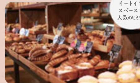
広い イートイン スペースも 人気のヒミツ。

時 11:00-14:00 17:00-20:00 休 火曜 / Tuesday