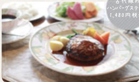
古代豚の ハンバーグステーキ 1,480円税込

時 11:30-13:30 17:00-21:00(夜は要予約) 休 木曜 / Thursday