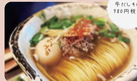
牛だしそば 980円税込