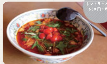
トマトラーメン 660円+税

時 11:30-14:00 17:30-22:30 休 水曜 / Wednesday