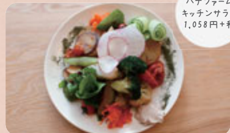
ハナファーム キッチンサラダ 1,058円+税

時 7:00-19:00 休 月曜 祝日の際は営業、翌火曜休み / Monday (Open on public holidays and closed on next Tuesday)