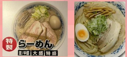
ラーメン・ご飯 もつ・まぜそば