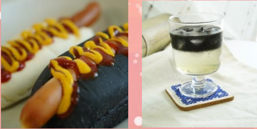
竹炭レモネード 竹炭ホットドッグ・ポテト