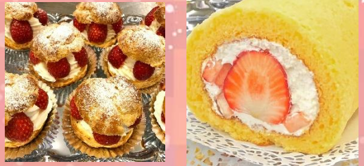
いちごのWシュー・とろけるプリン イチゴロール・パウンドケーキ メレンゲクッキー