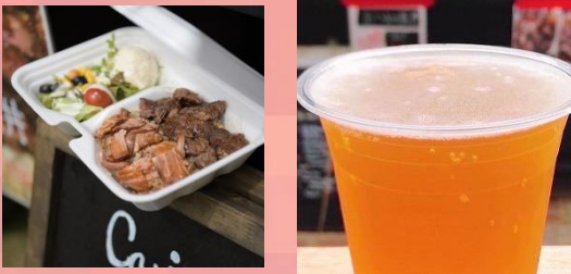
アンガス牛のステーキ クラフトビール